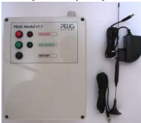
Schváleno bylo zakoupení svolávacího za ízení PELIG Modul v 1.1. Zajiš uje multifunk ní komunika ní rozhraní pro p enos informací z opera ního st ediska HZS na jednotky dobrovolných has í . Pro komunikaci používá služeb GSM síť mobilních operátor .