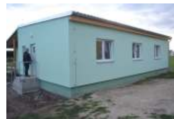
Novinky ze sportovního areálu strana 11