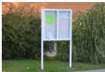
Nový školní rok 2015/2016 strana 6