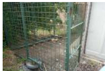
Pokračování výstavby v obci strana 3