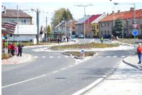
Zastupitelé projednali a schválili bezúplatné převzení majetku Olomouckého kraje obci, Olomoucký kraj po dokončení akce „Rekonstrukce komunikace II/570“ (přítah), převeďte obci dohodu bezúplatně pozemky a veřejné osvětlení v hodnotě 6 688 044,47 Kč.