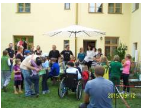
Letošní farní den se uskutečnil v sobotu 12. září.