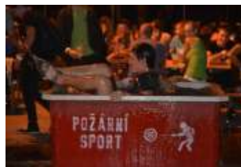
Probíhaly 3. pivní hněvotínské slavnosti strana 8