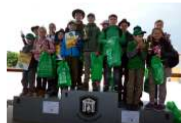
Družina mladých myslivců má za sebou čtyři roky působení strana 11