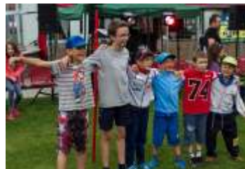
Ve sportovním areálu proběhl 2. ročník soutěže o "Gladiátora obce" strana 8-9