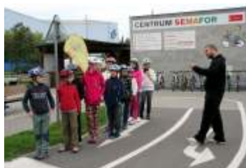
Ze života základní a mateřské školy Hněvotín strana 4-5