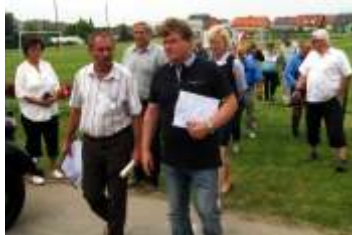
Jak dopadla obec v soutěži "Vesnice roku 2015" strana 3

Úspěch ve sportovní soutěži "Pohár starostů" - každý žák se vrátil z Olšan s medailí.