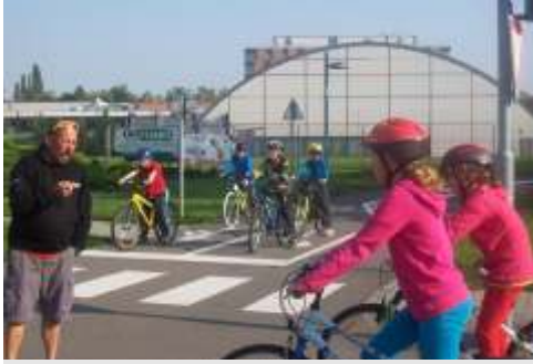
Lektorka, která s žáky v závěru testovali, doporučila prověřit jízdu na kole pod kontrolou rodičů.

Žáci 5. třídy jezdili v rámci zájmové skupiny na dopravní hřiště v Olomouci, kde se učili pravidlům silničního provozu a praktické zvládnutí jízdy na kole v různých dopravních situacích. Mnozí poznali, že jejich znalosti a hlavně praktické dovednosti ještě nejsou na takové úrovni, aby mohli samostatně vyjet na silnici.