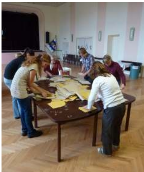
Snímek zachycuje volební komisi při posuzování obsahu volebních urn. Obálky formátu A4 pro obecní volby se ukázaly jako velice nepraktické.