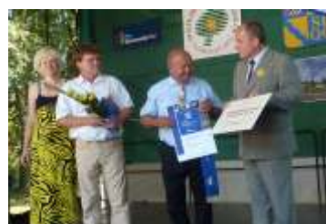
Účet zastupitel za volební období 2010 - 2014 strana 3