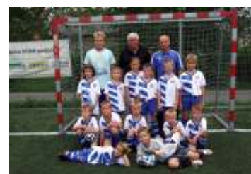
Zaaly podzimní fotbalové boje strana 12