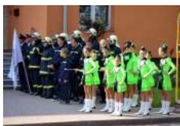
Hněvotín byly předány nové symboly - znak, vlajka a insignie strana 9