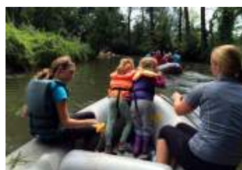
Hněvotín baštou vodáckého sportu strana 10