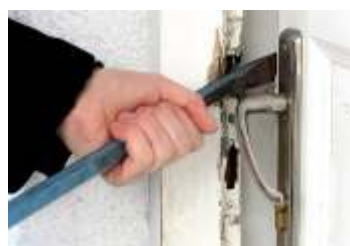
Bezpečnostní situace v obci v roce 2013 strana 8