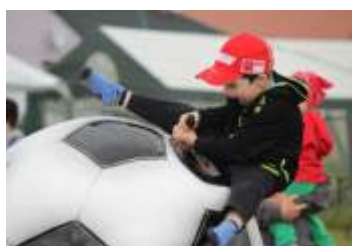
Hněvotín ovládl gladiátorské hry strana 6 – 7