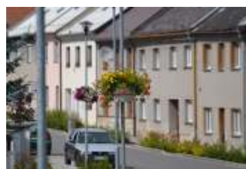
Bezmála 400 květinových truhlíků bylo rozvezeno po obci strana 2