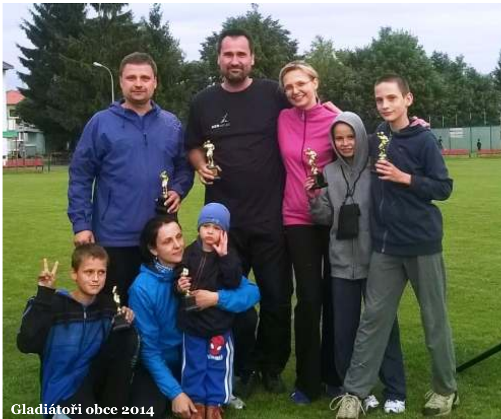
Gladiátoři obce 2014