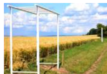
Fit stezka Hněvotín pro pravidelný pohyb strana 10