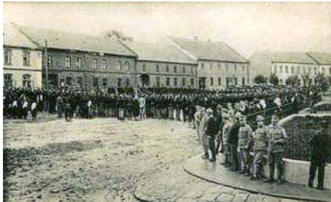
Na dobovém snímku z Hněvotína je zachycena nastoupená dělostřelecká jednotka.