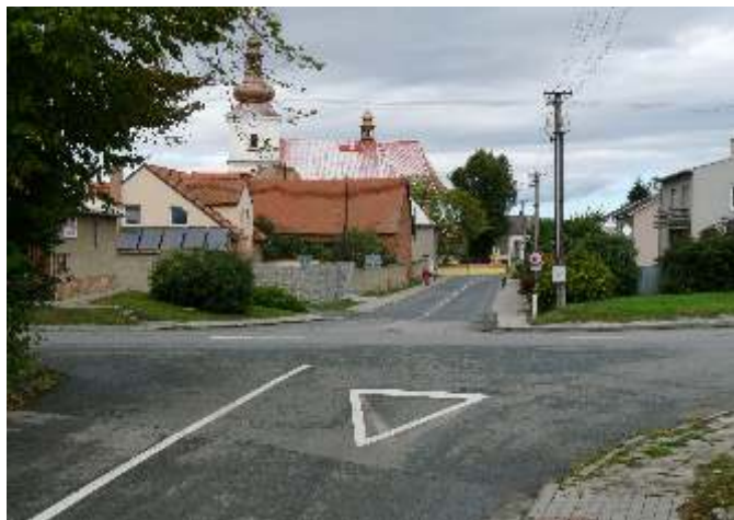
Na tomto místě se bude nacházet kruhový objezd.