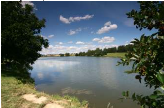
Závody dračích lodí se každoročně konají v nádherném prostředí přehrady Skalička.

První ze tří kvalifikačních jízd skončila a jedenadvacetičlenná posádka z Hněvotína, v níž musely být podle regulí nejméně čtyři ženy, zamířila na svou základnu. Dva velké stany si tým složený ze starousedlíků i nových obyvatel z ulice Za Hřištěm postavil hned ráno na břehu přehrady.