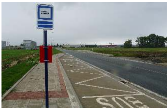
Na snímku je nově zřízená zastávka v areálu Technologického parku. Tuto zastávku obsluhuje i MHD Olomouc, konkrétně linkou číslo 24, jezdící na trase Olomouc Náměstí hrdinů – tržnice – Slavonín – Nedvězí - Technologický park a zpět.

Nebudeme zde uvádět kompletní jízdní řády, ale doporučujeme vám důkladně si je prostudovat.