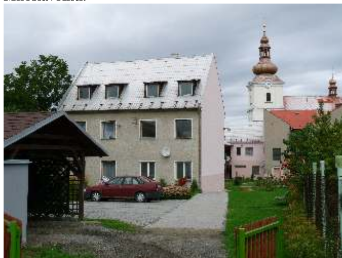
Projednáno také bylo zrekonstruování bytu 2+1 v 2. NP a dvou bytů 1+1 umístěných v půdní vestavbě zadního traktu Domu s pečovatelskou službou.