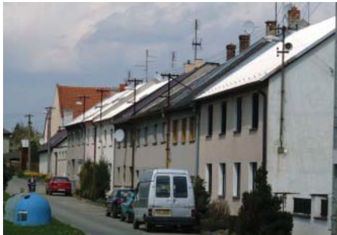
Kovové držáky elektrického vedení jsou současně osazeny i lampami veřejného osvětlení a tlampači obecního rozhlasu. Zmizí v blízké budoucnosti ze střech Malého a Velkého Válkova?

Již několik měsíců řeší firma ČEZ přeložení elektrických rozvodů v lokalitě Velkého a Malého Válkova, odkud by měly zmizet sloupky elektrického vedení a veškeré rozvody