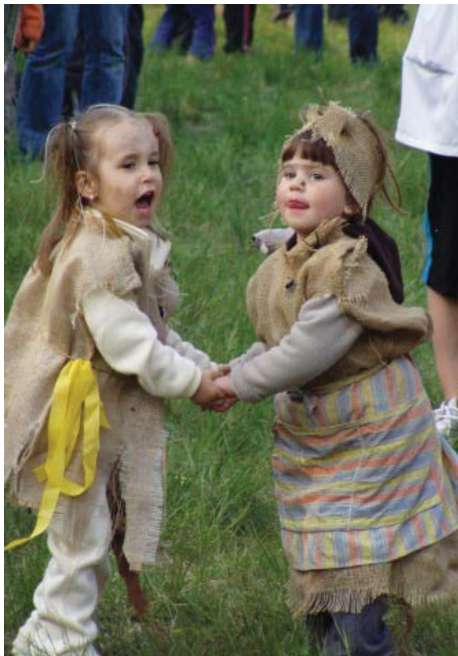
Hněvotínské skaly se v pátek 30. dubna stanou přistávací plochou i pro takové hezké adepty čarodějnického umění.

Touto cestou bychom chtěli všechny pozvat na tradiční slet čarodějnic do hněvotínských skal na pátek 30. dubna 2010 a na akademii ke Dni matek do Kulturního domu Hněvotín v pátek 7. května 2010.