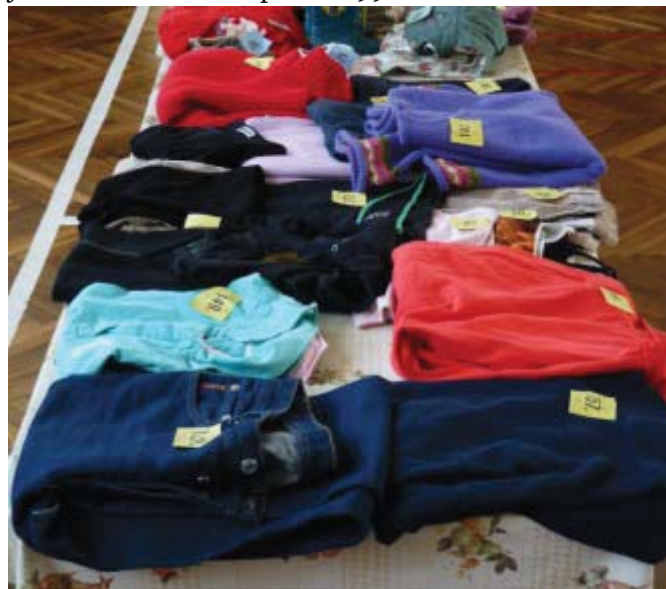
Oblečení bylo na Bazárku nejvíce nabízeným sortimentem.

V prostoru tělocvičny souběžně probíhal „Bazárek“. Bylo zde možné zakoupit nejen oblečení pro všechny věkové kategorie, ale i obuv, kolečkové brusle, autosedačky a jízdní kola. Celkem se prodalo 99 kusů zboží.