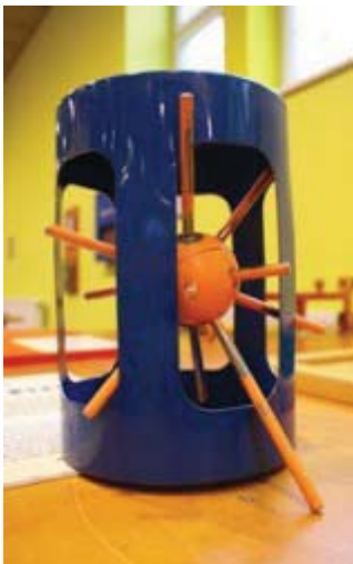
Ježek v kleci - legendární hlavolam, který na takové výstavě nesměl chybět.