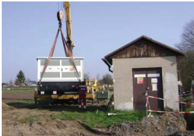
Na snímku pracovníci provádějí výměnu přepojovací kobky za stávající trafostanici v ulici Za školou.

I přes informaci v prosincovém vydání Zpravodaje, přetrvávají i nadále nejasnosti ve financování třech nových transformátorů, rozvodů vysokého a nízkého napětí v lokalitách Za školou, Za hřištěm, včetně obou „Válkovů“.