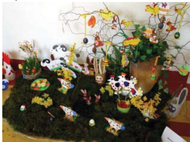
Námaha všech, kteří se na velikonočních výzdobách podíleli, jistě stála za zhlédnutí.

V prostoru nově zrekonstruované školní družiny byly vystaveny výrobky našich žáků, které mohly návštěvníkům sloužit jako inspirace pro velikonoční výzdobu vlastních domovů. Dle vyjádření spoluobčanů, kteří výstavu navštívili a dobrovolným vstupným přispěli na financování akcí pro děti, se výrobky dětí z mateřské i základní školy, stejně jako aranžmá celé výstavy, velmi líbily.