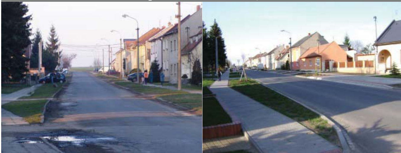
provedena revitalizace za 4,5 miliónů Kč