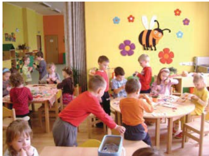
Děti vystřihovaly zajíčky, beránky, malovaly vajíčka a zdobily mateřskou školu.

S těmi nejlepšími výrobky jsme se představili na tradiční velikonoční výstavce v základní škole.