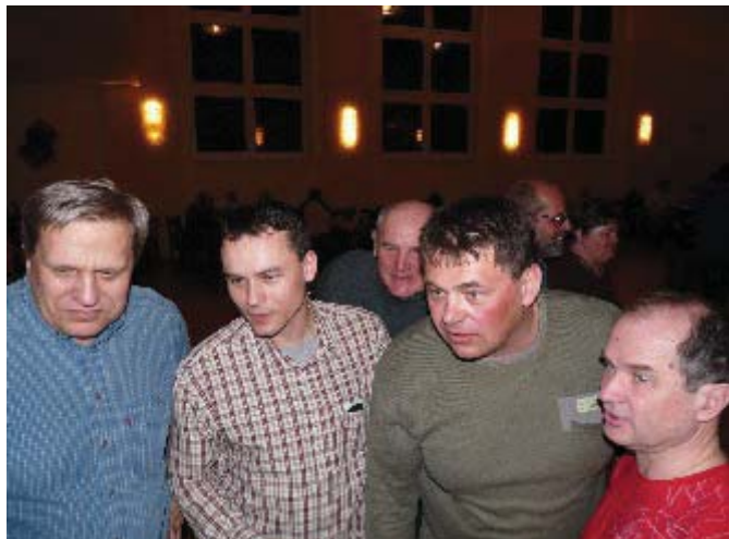
Pohledy na zveřejněné výsledky se někdy, jak dokládá fotografie, velice různily.