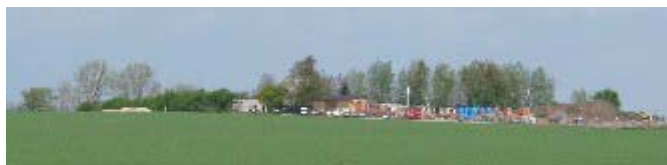
Na místě bývalého radaru Armády české republiky dnes můžeme nalézt firmu Ministavebniny.

Hlavním bodem jednání bylo schválení žádosti o pořízení souboru změn č.3 Územního plánu obce Hněvotína. O této otázce již jednáme prakticky rok. Poslední úpravy návrhu změn byly projednávány na zasedáních v říjnu a v prosinci 2009 a v únoru 2010. Obec změny navrhuje, ale pořizovatelem plánu a jeho změn je Magistrát města Olomouce – Odbor koncepce a rozvoje. Ten naše návrhy posoudil a obci navrhl, aby tři lokality z celkových devíti do žádosti nezahrnoval, jelikož jsou v rozporu se zásadami plánování územního rozvoje. Jedná se o zábor části pozemku hřiště FC Hněvotín a o změnu využití pozemku bývalého radaru Armády České republiky.