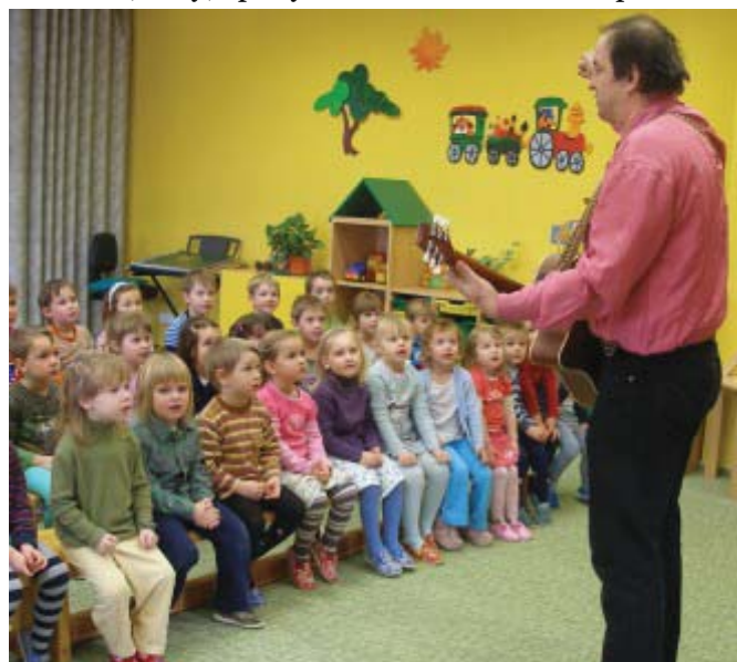
Dětské publikum bylo velmi vnímavé a pozorné.

V úterý 16. března 2010 jsme pro děti objednali pořad Zpívánky. Program obsahoval známé lidové písně, které si děti společně zazpívaly, říkadla podpořená malovanou dekorací, hry, pohybová cvičení a minipohádku.