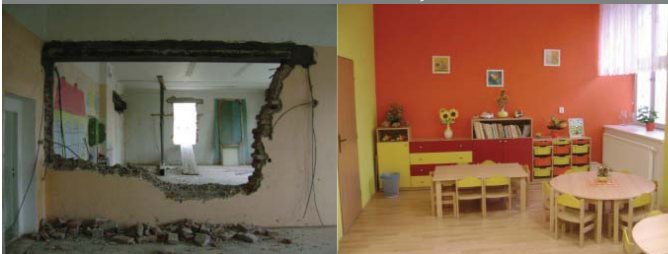
provedena rekonstrukce za 9 miliónů Kč