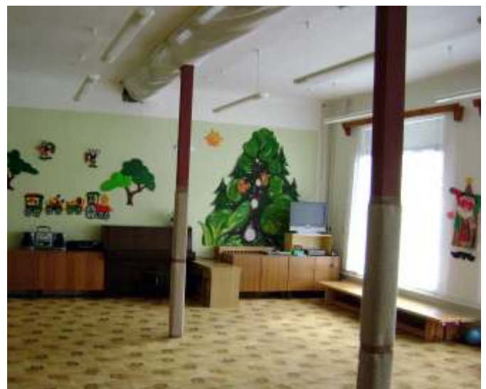
Herna mateřské školy se sloupky zajišťujícími statiku.

Stejně jako v prvním pololetí, tak i ve druhém pololetí školního roku jsme pro děti připravili plno zajímavých aktivit.