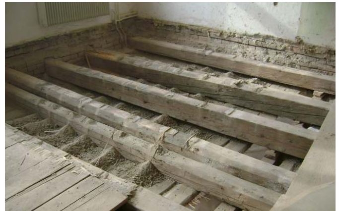
Po odkrytí podlahy a kontrole stropu se ukázalo statické zajištění jako nezbytné.

Bylo připraveno staveniště včetně zřízení stavebního výtahu a prořezání stropů ve zdech pro snadnější vyvážení stavebního materiálu.