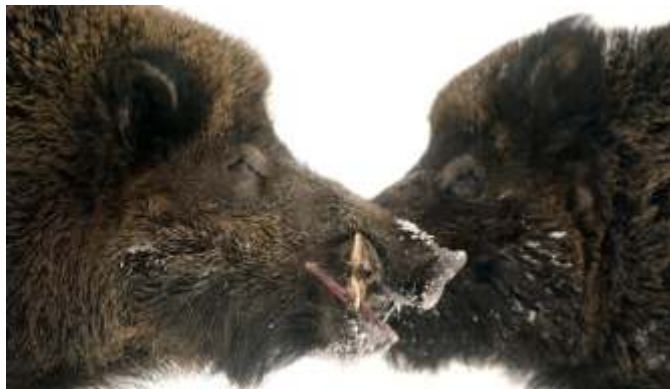
Podobný „fešák“ byl k mání v tombole.

„Když myslivecký, tak myslivecký!“ S touto myšlenkou jsme se snažili hostům připravit krásný večer plný zážitků a zábavy. Prostory Kulturního domu se rázem proměnily ve voňavý les, ve kterém nechyběla ani zvuka myslivecká zařízení. V krmelci jsme nabízeli zvěřinové pochoutky, srnčí řízky, guláš a nebo pečeného divoáka. Ve studánce pak k životu potěbné tekutiny a v nože U starého jezevce si mohli na své milovníci nápoj ostřejších.