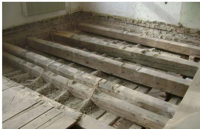
Po odkrytí podlahy a kontrole stropu se ukázalo statické zajištění jako nezbytné.

Bylo připraveno staveniště včetně zřízení stavebního výtahu a prázdné veškeré prostory pro snadnější vyvážení stavebního materiálu.