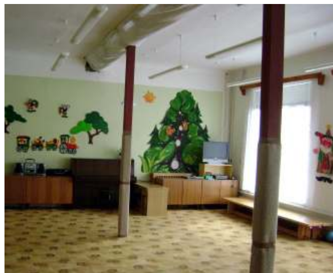
Herna mateřské školy se sloupy zajišťujícími statiku.

Stejně jako v prvním pololetí, tak i ve druhém pololetí školního roku jsme pro děti připravili plno zajímavých aktivit.