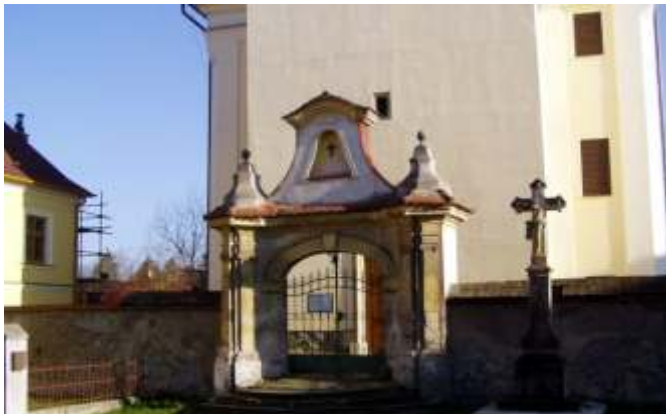
Starší snímek ukazuje kamenný kříž umístěný před kostelem. Jeho místo je v současné době prázdné, kříž čeká na svoji opravu v restaurátorské dílně.