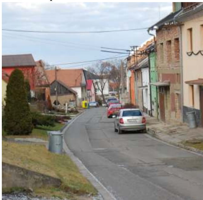
Na jarní měsíce je plánováno i pročištění domovních přípojek a vodovodního řádu na Malém Klupovi.

V tomto ročním období bude firmou SMP a.s. zahájena i rekonstrukce plynových rozvodů v obci, a to na těchto trasách: