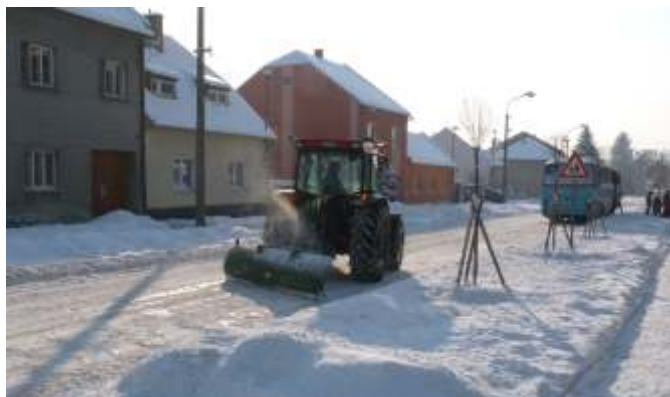
Zastupitelstvo se také zabývalo zimní údržbou v obci a schválilo příslušné smlouvy.

Byly projednány žádosti o příspěvky. Zastupitelé zamítli žádost o podporu Sdružení Linka bezpečí, se sídlem v Praze, naopak odsouhlasili poskytnutí příspěvku ve výši 2 000,- Kč Římskokatolické farnosti Hněvotín na varhaní koncert.