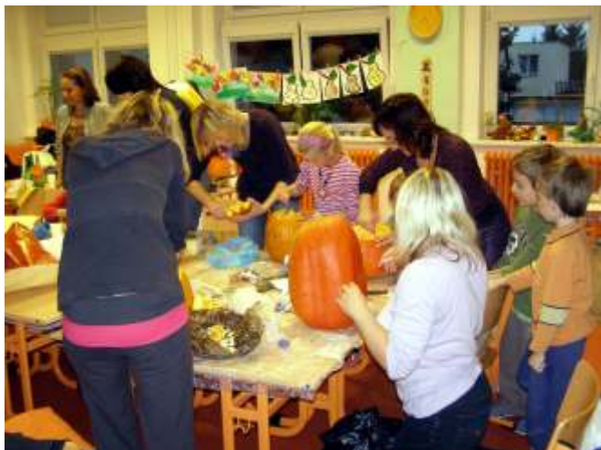
V měsíci listopadu se uskutečnila „Podzimní dílna“, na níž děti pod vedením svých rodičů vyráběly dýňové svítilny.

K oblíbeným aktivitám naší školy patří společná setkávání dětí se svými rodiči na pracovních dílnách. V tomto školním roce se uskutečnila již dvě setkání – podzimní a vánoční.