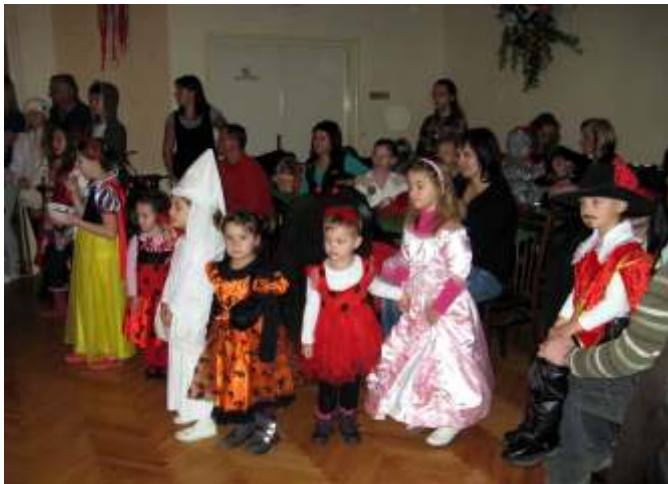
Od 16 hodin byl v sále Kulturního domu Mikulášem, čerty a anděly zahájen „Mikulášský karneval“. Naplno se tím rozběhla zábava dětí z mateřské a základní školy. To vše v režii vedení základní školy a rodičů.

V pátek 2. prosince 2011 se uskutečnilo „Rozsvícení vánočního stromu obce“. O tradici a oblíbenosti této předvánoční akce svědčí účast přibližně 600 – 700 občanů nejen z Hněvotína, ale i hostů ze sousedních vesnic a z Olomouce.