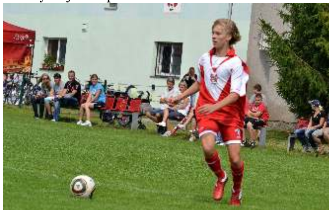
Pozitivem podzimní části soutěže bylo účinkování 17-ti letého odchovance oddílu Jiřího Veselského, který jako střídající hráč nastoupil do několika zápasů. V domácím utkání s Konicí se dokonce prosadil i střelceky a zaznamenal svůj premiérový gól v krajském přeboru mužů.

Tým mužů na podzim nasbíral 17 bodů (v r. 2010 jich měl 18, v r. 2009 opět 17), což v tabulce stačilo na 14. místo. Mužstvo se opět potýkalo s úzkým kádrem, který navíc oslabovala zranění nebo vyloučení, často klíčových hráčů. Zbytečné ztráty bodů vyvrcholily prohrami v zápasech s Lošticemi a Dolany, v té době suverénně posledními týmy tabulky krajského přeboru.