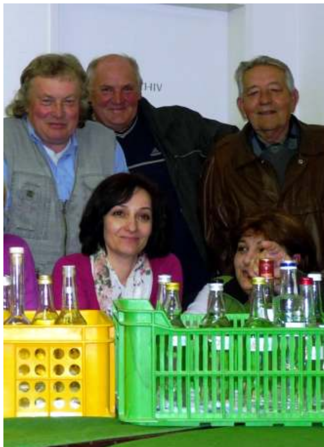
Nenechte se mýlit, toto není skupina „vysmátých“ pacientů s krutou diagnózou. Tak může dopadnout snímek, když si skupina „vysmátých“ porotců soutěže o nejlepší obecní pálenku stoupne při fotografování před obecní archív.