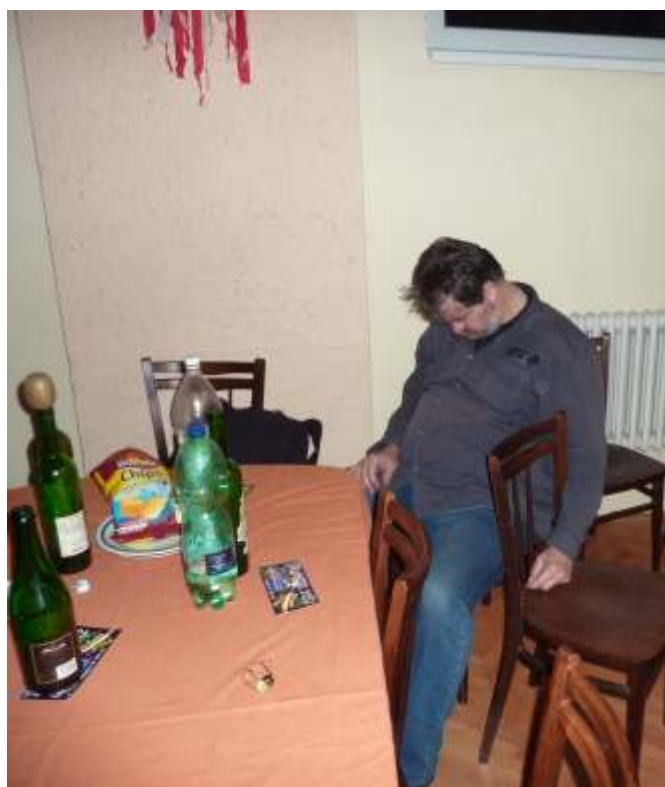
Prosinec 2012. Redakční uzávěrky bývají hektické...