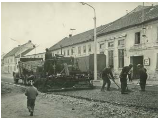
Konec padesátých let. V Hněvotíně se opravují silnice. Malý chlapec v popředí v kulíšku s bambulí je malý Jaroušek Dvořáků. Pečlivě sleduje probíhající práce, aniž by tušil, jak se mu to bude za padesát let hodit.