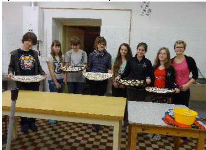
V předvánočním čase se ve škole uskutečnily vánoční dílny, kde si žáci mohli vyrobit drobné dárečky a ozdobit perníčky.

Žáci 9. ročníku si pomalu vybírají střední školu, a tak absolvují různé akce zaměřené na volbu povolání. Zhlédli například výstavu „Scholaris“, která každoročně představuje jednotlivé střední školy Olomouckého kraje, a účastnili se besedy s pracovníky Informačního a poradenského centra Úřadu práce v Olomouci.