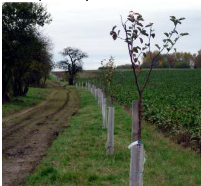
Uzavřeli jsme pro provoz polní cestu za „Velkým Válkovem“. Léta ji zemědělci nepoužívali. Nešlo to kvůli keřům a náletovým dřevinám. Dali jsme ji do pořádku, srovnali, osadili nové stromy. A problém je na světě.

Podíváme-li se však na problematiku z jiné stránky, musí zemědělci připustit, že zde vlastně také jde o podnikání jednotlivců, nebo v našem případě také místního zemědělského družstva. My, kteří v obci žijeme, máme však také své zájmy. Bydlíme tu a i my máme právo přírodu v okolí obce využívat k relaxaci, procházkám i dalšímu sportovnímu vyžití.