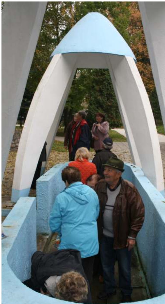
Na podzim navštívili hněvotínští senioři i lázně v obci Skalka, která leží přibližně 8 km od Prostějova.

Prošli jsme všechny expozice, seznámili se s objevy egyptských pyramid, poznali historii města Olomouce a jeho slavné osobnosti. Nabytí vědomostmi jsme posílili i tělo dobrým obědem v restauraci „U Huberta“. Pěší návštěvou vánoční Olomouce jsme si také trochu zaspotovali. A protože jsme lidé spořiví, našetřili jsme si i na slavnostní ukončení roku 2013, které se bude konat 27. prosince v restauraci „Neptun“ v Lutíně (chtěli jsme pobýt doma v Hněvotíně, ale bohužel bylo již obsazeno).