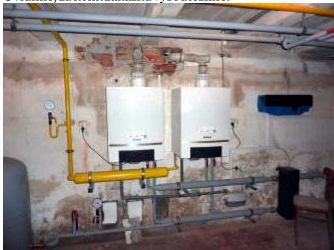
Rekonstruována byla plynová kotelna v Kulturním domě a 27 let staré několikrát zatopené kotle byly nahrazeny novými kondenzačními plynovými kotli.

- revitalizaci centrální části obce s rekonstrukcí II/570 (tzv. průtah obcí ve směru Olomouc – Lutín). Bude to velmi rozsáhlá a náročná akce, jejíž celková cena činí téměř 50 milionů Kč. Hlavním investorem je Olomoucký kraj, obec Hněvotín se na rekonstrukci bude podílet částkou 10,1 milionů Kč (z toho částku ve výši 6,7 milionů Kč pokryje dotace z Regionálního operačního programu). Uvidíme, za kolik zakázku vysoutěžíme.