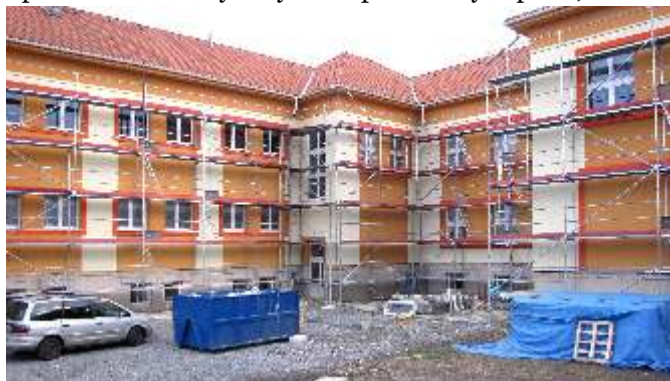
Jeden z projednávaných bodů programu řešil dodatek se Stavební společností Navrátil s.r.o., kterým se kvůli mrazům přerušily práce na zateplení školy. Pokračovat se bude v březnu 2014.

- dodatek smlouvy s akciovou společností Europa CS o posunutí termínu dokončení a předání díla „Komunikace U Zahradek“ o jeden měsíc, z důvodu upřesnění skutečných výměr u provedených prací;