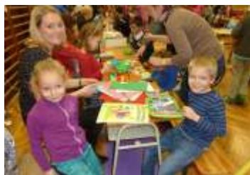
Tradiční "Vánoční dílna" základní školy jinak strana 6