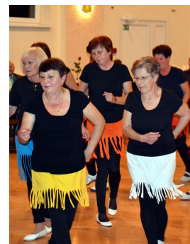
Taneční skupina ze skupiny BABA.