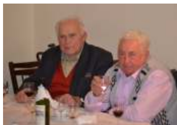
Setkání seniorů obce mimo velký ohlas strana 8