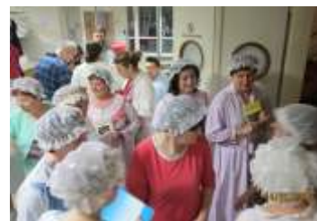
Pozvánka na nejbližší kulturní a společenské akce strana 12