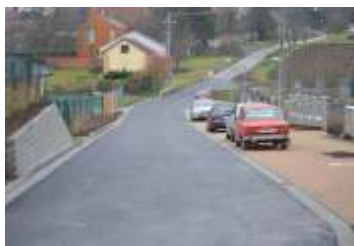
Účet zastupitelstva obce za rok 2015 strana 2 - 3