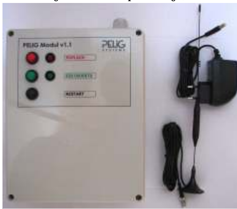
Schváleno bylo zakoupení svolávacího za ízení PELIG Modul v 1.1. Zajiš uje multifunk ní komunika ní rozhraní pro p enos informací z opera ního st ediska HZS na jednotky dobrovolných has í . Pro komunikaci používá služeb GSM síť mobilních operátor .