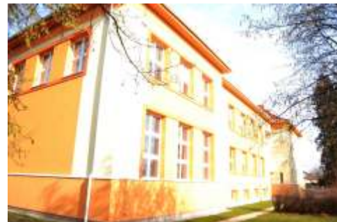
Na jednání bylo odsouhlaseno i uzav ení smlouvy se spole ností Energy Benefit Centre a.s. z Prahy, která obci nabídla zpracování žádosti o navýšení dotace na již provedené zateplení budovy základní školy.

na akci Revitalizace centrální ásti obce Hn votín.