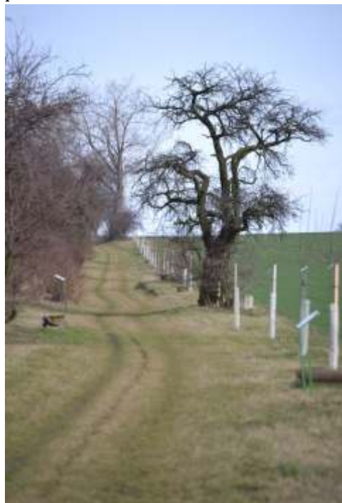
Mezi žádostmi adresovanými na obecní ú ad byl i dotaz na umožn ní pr jezdu zem d lské techniky p es fitness stezku. Stanovisko zastupitel bylo jednozna n zamítavé.