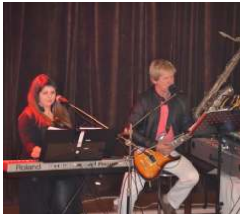
Setkání seniorů se na jaře koná na základě velmi úspěšného podzimního setkání, opět se skupinou Na Ostro.

Ke kterým akcím ještě poznámka. „Babička v trenkách“ je divadelní představení ochotníků z Bukovan. Hn votínský košť je již tradiční klání vyznava slivovice a jiných pálenek, spojené s kulturním programem a ochutnávkami. Slavnostní přejezdem kočáru přes Hn votín bude zahájena turistická sezóna v mikroregionu Kosísko.