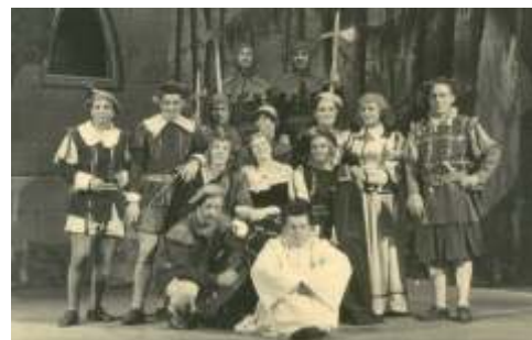
Snímek z 50-tých let zachycuje hn votínské ochotníky před představením "Hadrián zims".