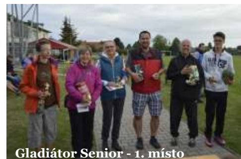
Gladiátor Senior - 1. místo