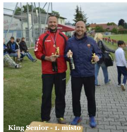
King Senior - 1. místo

Periodický tisk územního samosprávného celku. Vydává: obec Hněvotín, IČO 00298913. Adresa: Hněvotín 47, 783 47. Vychází: šestkrát ročně v nákladu 600 ks. Evidenční číslo MK ČR E 12642. Vydání číslo 50. vychází 30. 6. 2017. E-mail: redakce@hnevotin.cz , www.hnevotin.cz . Redakce si vyhrazuje právo na úpravu příspěvků.