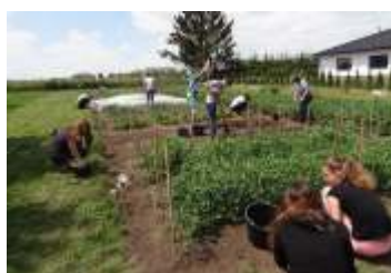
Pěstitelské úspěchy žáků základní školy strana 6