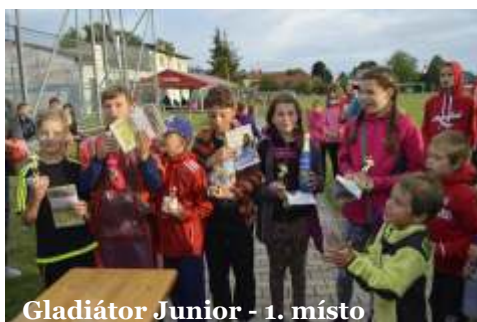
Gladiátor Junior - 1. místo