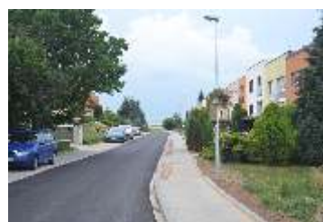
Pokračující výstavba v obci strana 3