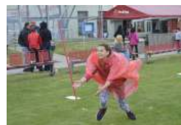
Sportovní den TJ FC Hněvotín strana 10-11