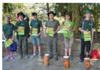
Skvělá reprezentace Vlčat z Hněvotína strana 9