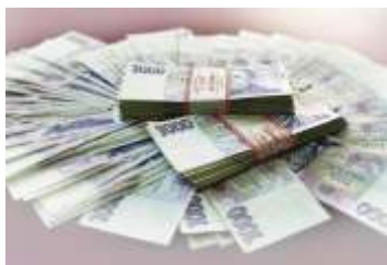
Byl schválen nejvyšší rozpočet v historii obce strana 2