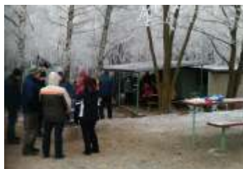
Pozvánka na akce pořádané na Nový rok strana 8