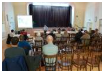
Bylo projednáno a schváleno zadání nového územního plánu strana 4