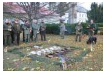
První letošní vycházka hněvotínských myslivců strana 10