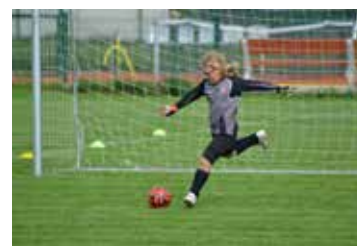
Fotbalový podzim TJ FC Hněvotín strana 10