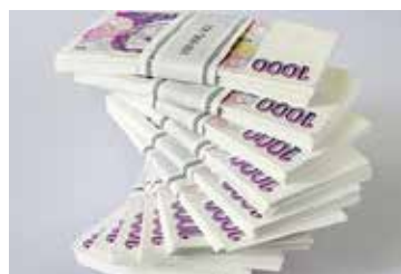
Obecní zastupitelé schválili rozpočet na rok 2019 strana 3