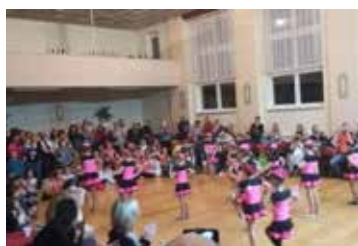
Mikulášské hrátky, tentokrát očima dětí základní školy strana 6