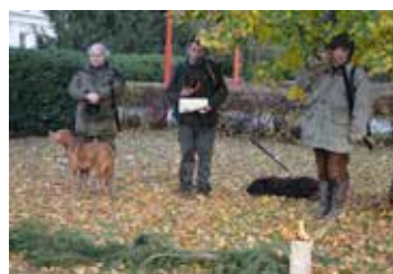
Z hněvotínských vycházek Mysliveckého spolku Blata strana 8 - 9