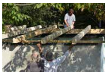
Z činnosti Mysliveckého sdružení Blata strana 9 - 10