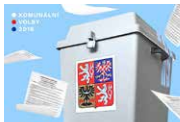
Výsledky voleb do zastupitelstva obce strana 4