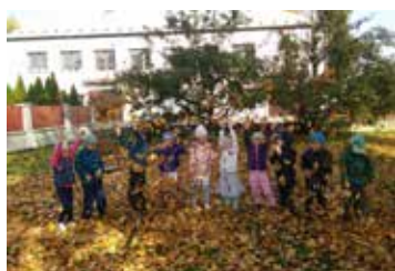
Podzim v hněvotínském mateřské škole strana 7