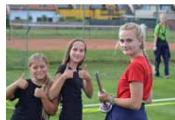
Sportovní den TJ FC Hněvotín strana 11