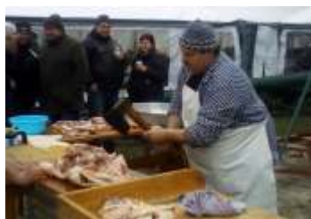
Obci provoněly ovar, jelita a jitrnice - 2. ročník veřejné zabijačky strana 8