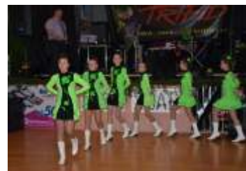
Připravuje se program akce Dny obce a sjezd rodáků strana 10