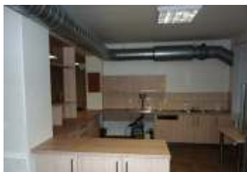
Byly zadány zakázky malého rozsahu strana 2