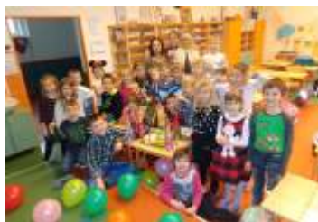
Informace k zápisu do základní a mateřské školy strana 4