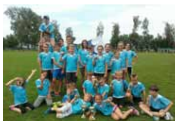
Sportovní úspěchy žáků základní školy strana 6