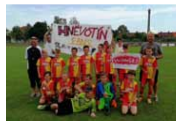
Fotbalové jaro ve znamení úspěšných výsledků strana 12