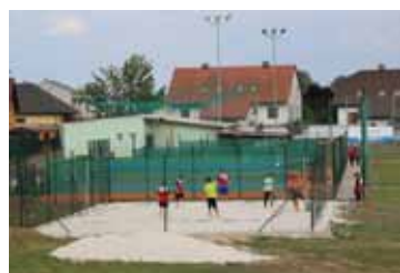
Odkoupení nemovitého majetku TJ FC Hněvotín, z.s. strana 3