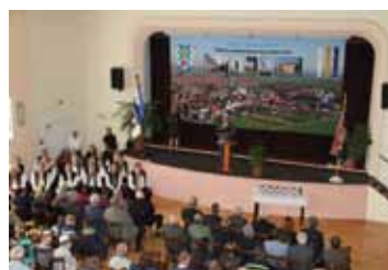
Uskutečnila se akce Dny obce a sjezd rodáků strana 8 - 9