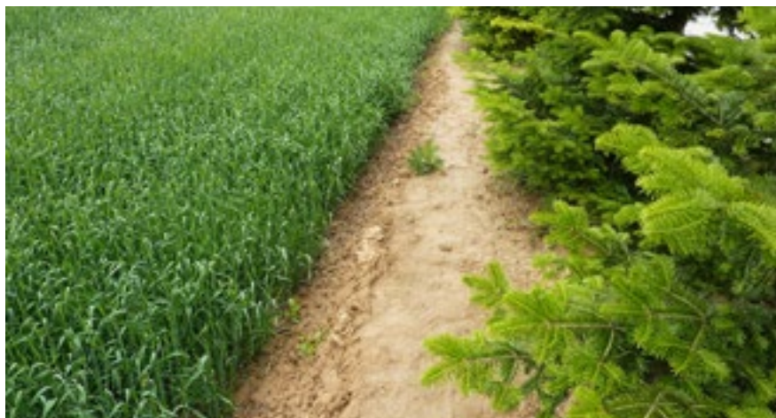
Uložení zeminy na pozemek souseda v lokalitě za hřištěm