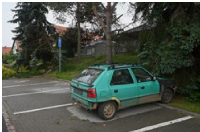
Odstavený autovrak v ulici U Floriánka