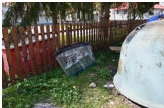
Odložený odpad mimo kontejnery na tříděný papír, plast a sklo u hasičské zbrojnice

Někteří občané stále považují veřejné prostranství za odkladiště svého odpadu, dokonce neváhají „odložit“ i autovrak.