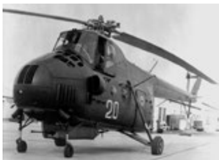
Vrtulník Mil Mi-4 – stejný typ havaroval před 33 lety v západní části obce