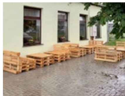
Restaurace na hřišti – nový provozovatel, sociální zařízení i venkovní posezení