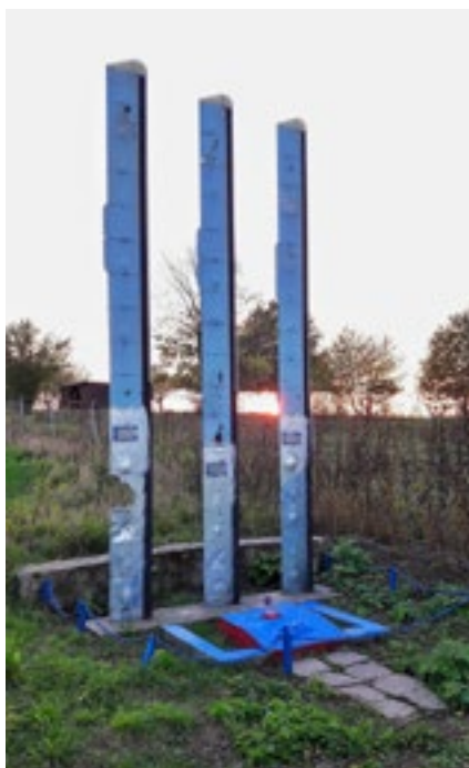
Pomník sovětským vojákům, kteří zahynuli při nehodě vrtulníku u Hněvotína