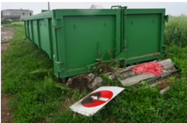
Nebezpečný odpad u biokontejneru směrem na Skaly