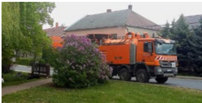
Čištění potoka v centru obce