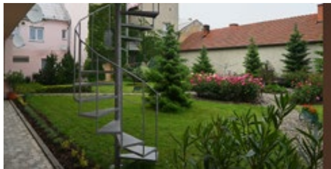
Nové únikové schodiště v Bytovém domě seniorů

Snažíme se pokračovat ve výstavbě podle našich možností a vývoje financování obcí. Máme něco našetřeno, hospodaříme a jedeme dál. Možná pomaleji ale s rozumem.