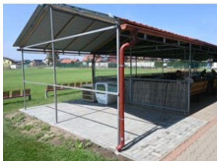
Plácek pro grill na hřišti