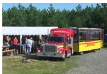
Lidé opět začali žít společenskými akcemi