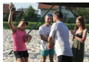
Premiéra Hněvotínského písku dopadla na jedničku