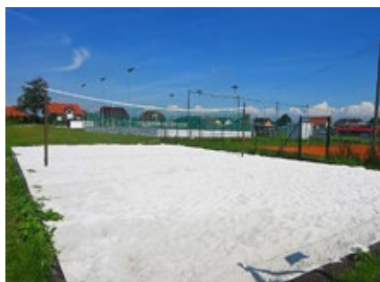
Nové hřiště na volejbal pro děti a mládež