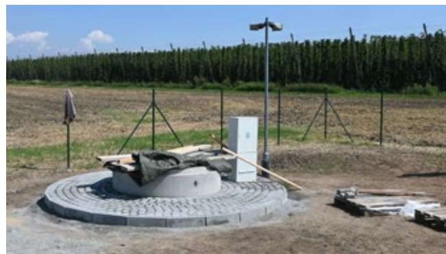
Vodárna u chmelnice