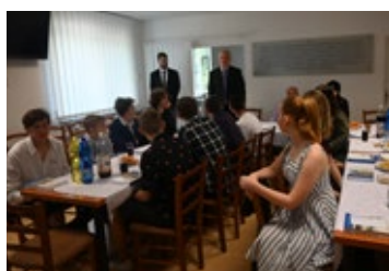
Devátáci se na obecním úřadě slavnostně loučili se školou