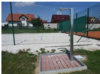
Sprcha u beachvolejbalového hřiště