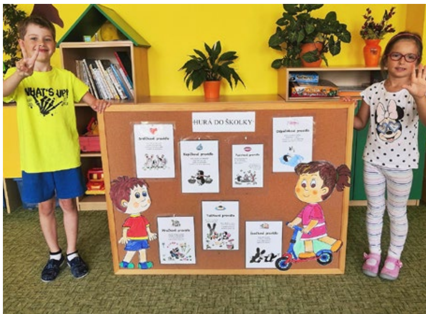
Osmnáct nováčků vítává 1. září hněvotínská školka