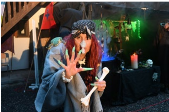
Merlinova chýše s ježibabou