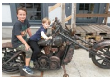
Hněvotínské děti na letních táborech