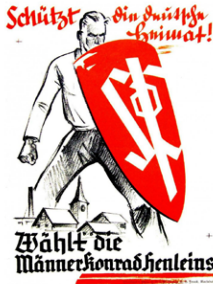
Plakát SdP, která vyhrála volby 1935 v Hněvotíně; překlad textu „Chraňte německou vlast! Volte Konrada Henleina a jeho muže!“