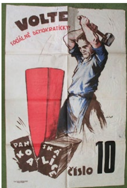
Volební plakát ČSDSD