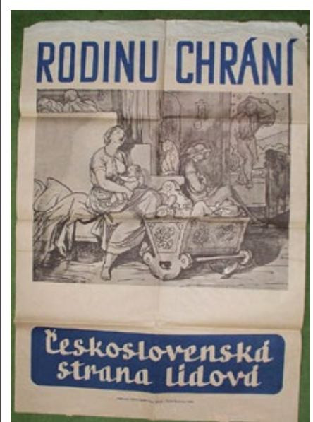
Volební plakát ČSL