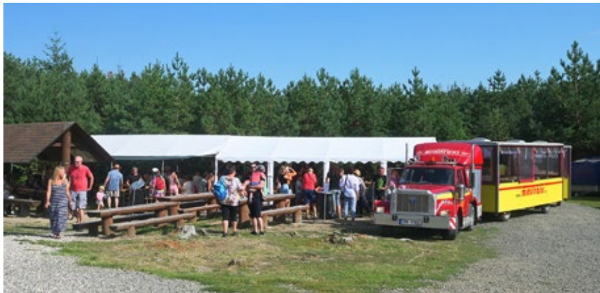
Výlet turistickým vláčkem na Velký Kosíř

Stovka obyvatel Hněvotína využila v sobotu 22. 8. příležitost a nechala se vláčkem vyvézt na vrchol Velkého Kosíře. Zde na účastníky čekalo občerstvení v podobě chlazeného piva a nealko nápojů a špekáčků k opékání. Nechyběl hudební doprovod, o který se postarala skupina MišMaš. Zájemci mohli bezplatně vystoupat na 28 metrů vysokou rozhlednu a pokochat se výhledem do krajiny. I když se během odpoledne stahovala mračna, déšť nakonec akci nenarušil, a všichni se tak z výletu vrátili suchou nohou. Vedení obce děkuje všem, kteří se na zajištění této akce podíleli.