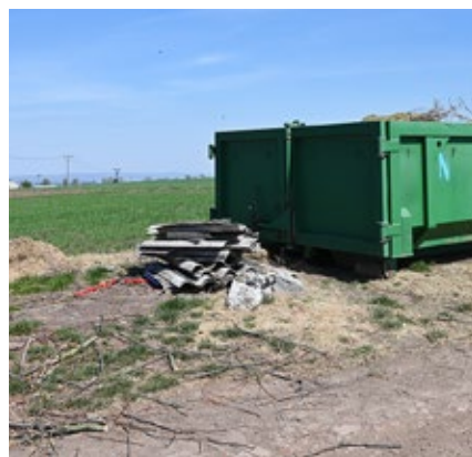
Krytina na místě bioodpadu