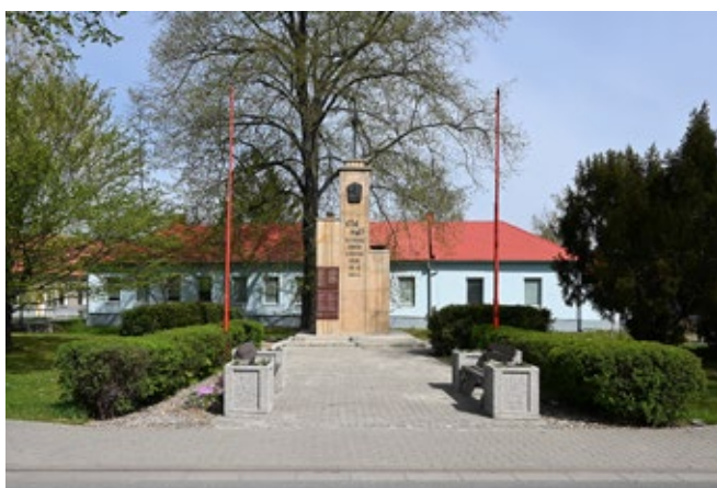
U pomníku odboje už zbývá jen dokončit úpravu povrchu schodiště