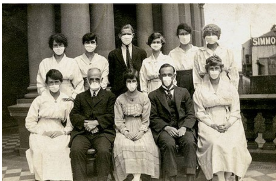
Ilustrační fotografie z období pandemie španělské chřipky. I tehdy bylo jedno ze základních opatření, jak šíření nemoci zabránit, nošení roušek. Jejich nošení bylo třeba v USA pro všechny také ze zákona povinné.