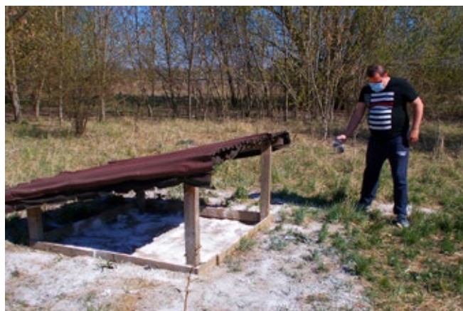
Úkoly plní také čekatelé

K tomuto není potřeba svolávat společnou akci, při níž by mohlo dojít k případnému rozšíření nákazy koronavirem. U nás má každé krmné zařízení konkrétního správce, který se o něj stará sám. V dubnu se v honitbě rodí nový život. Lišky vrhají mladé, bažanti a koroptve zakládají hnízda, hřivnáči a vrány již leckde hnízdí.