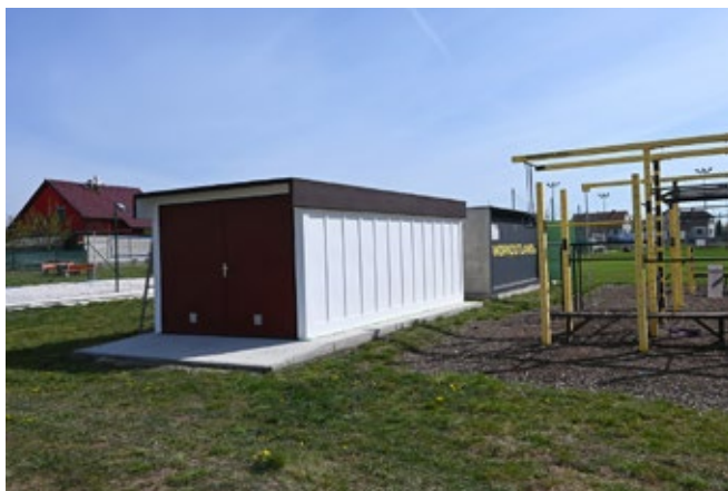
Nová betonová garáž, která slouží jako sklad ve sportovním areálu