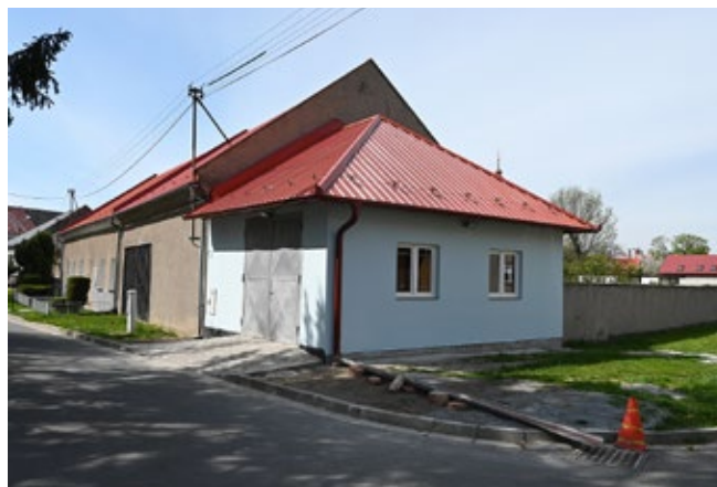
Opravená fasáda skladu „mandlovna“