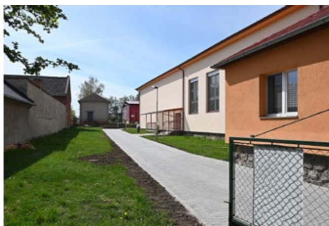
Stavebními úpravami prošla restaurace v kulturním domě

Ani v období poznamenaném koronavirovými opatřeními se úplně nezastavila práce technických zaměstnanců obce a odborných firem na plánovaných pracích.