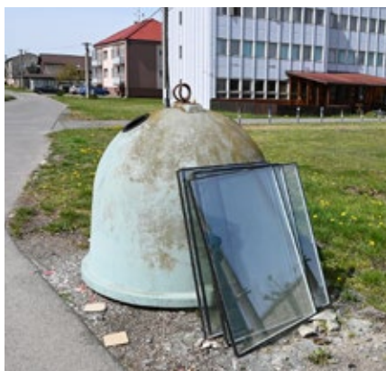
Odložené tabule skla