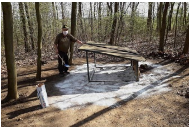
Desinfekce zásypu a okolí

První jarní dny jsou za námi a i přes stále trvající vyhlášený nouzový stav mají myslivci z MS Blata Hněvotín stále co dělat. S dubnem přichází plné jaro a končí období příkrmování. Nastává čas údržby, vyčištění a vydezinfikování všech zásypů a krmných zařízení. Veškeré zbytky krmiv se z nich musí odstranit, zakopat nebo odvézt a krmná zařízení dle potřeby opravujeme.