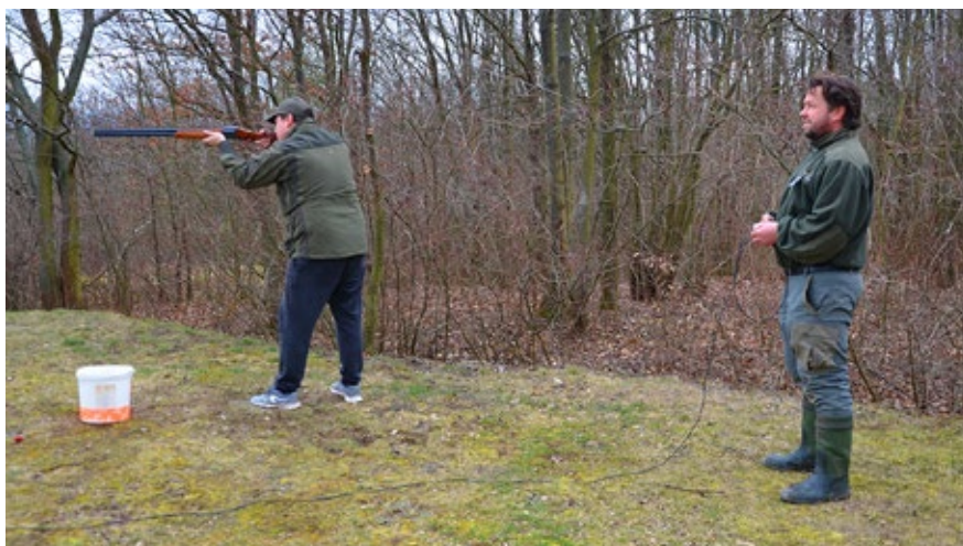
Střelec na stanovišti a za ním správce střelnice

Montáž „nové“ vrhačky netrvala dlouho, jenže opět nešla. To zaskočilo i samotného Pavla Tomana. „To není možné, vždyť fungovala,“ vydal ze sebe nešťastně a jeho tvář začala chytat nezdravou barvu. Lehl pod vrhačku a opět zkoumal, seřizo-