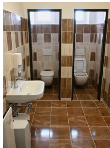
Opravené sociální zařízení v restauraci v budově obecního úřadu

Vedení TJ FC Hněvotín společně se zástupci občanů podepsaných pod peticí má nyní možnost a dostatek času vybrat si nového spolehlivějšího podnájemce restaurace, který bude řádně platit nájem spolku a beze zbytku splní požadavky občanů uvedené v petici tak, aby se zastupi-